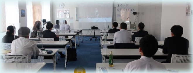
TKC柏センター研修室