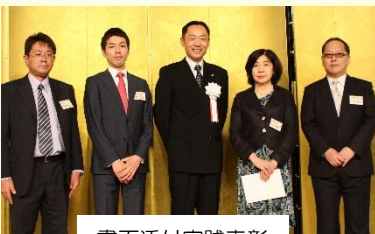
書面添付実践表彰