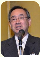
F×2自計化コンテスト