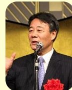
来賓祝辞 海江田 万里 様