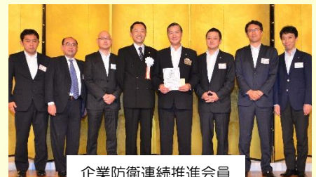
企業防衛連続推進会員