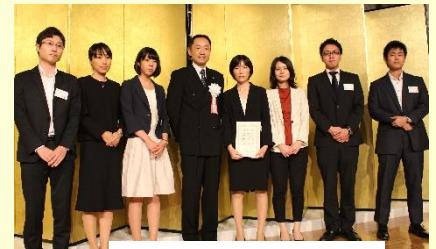
中級職員実務試験合格者