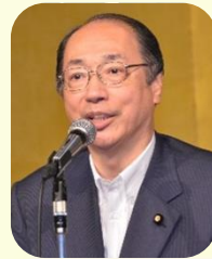
来賓祝辞 参議院議員 中川 雅治様