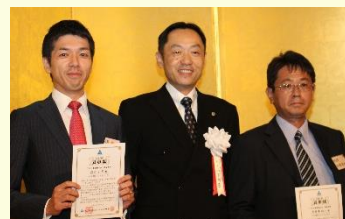
ニューメンバーズ：KFS初実践会員