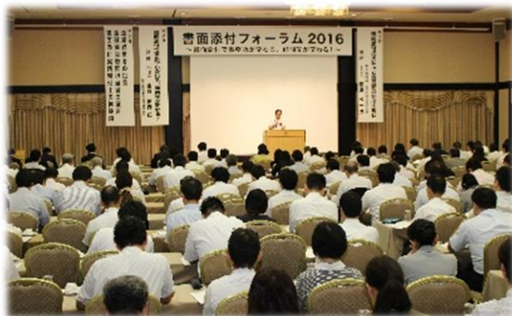
平成28年9月6日東京会場の様子