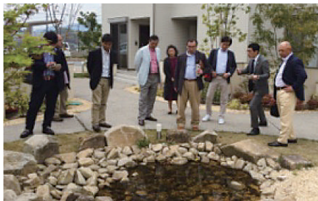
ラ・スリースガーデン視察研修風景