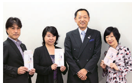
共済制度:キャンペーン支部表彰

事務局 広報部会、事務局 中小企業支援委員会 事務局 事務局 経理部会、事務局 事務局 事務局 事務局