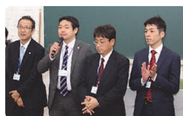
TKC東京都心会 運営委員