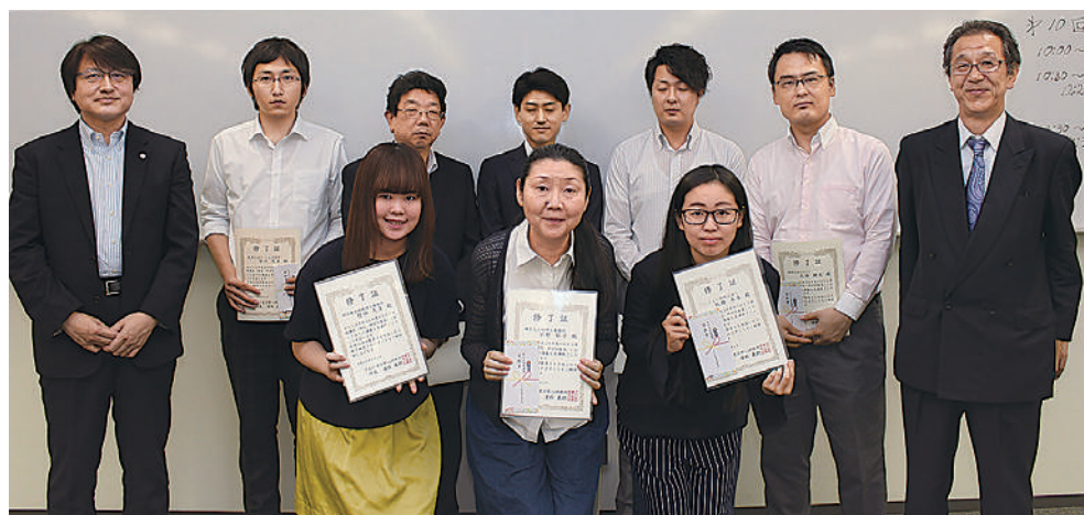
KFS実践講座10回を全て受講した8名には、修了証と記念品が授与されました。