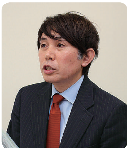
講師：種生丈士共済制度等推進委員長