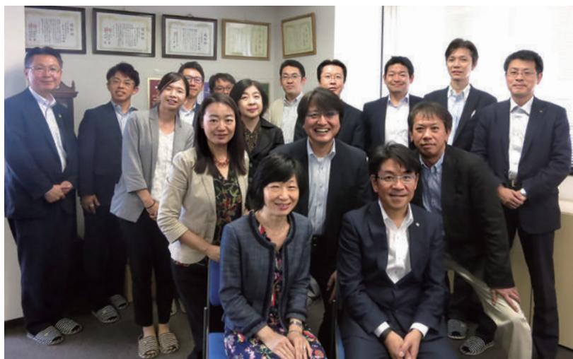
税理士法人京都経営の事務所見学会