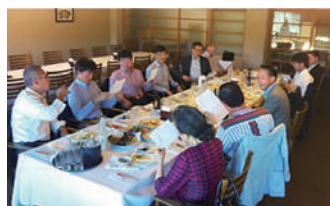
賀茂カントリークラブ成績発表