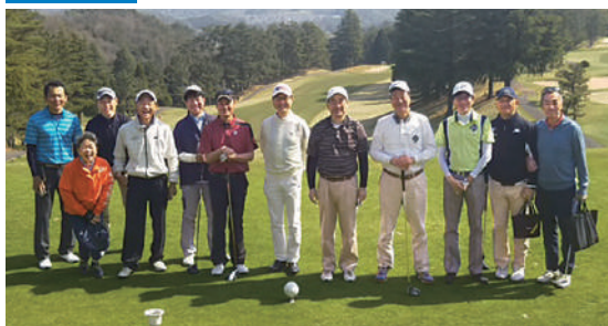
芸南カントリークラブ