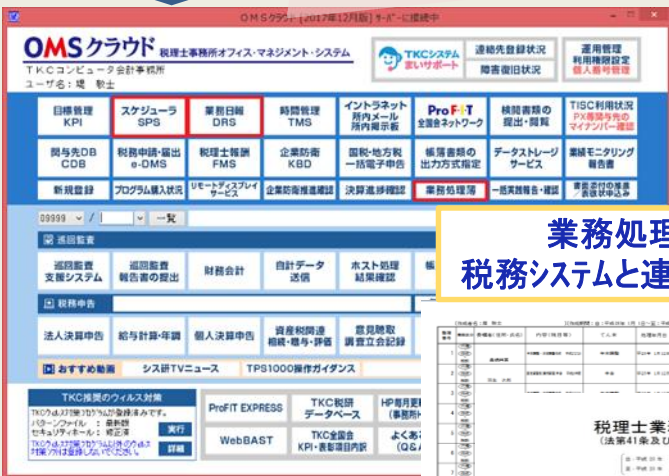
業務処理簿 税務システムと連動し作成