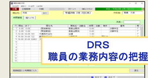
DRS 職員の業務内容の把握