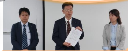
首都圏西SCGサービスセンター