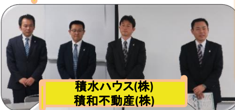
積水ハウス(株) 積和不動産(株)